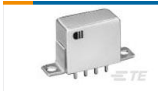
TE 产品编号2-1617004-8 B07D634BC2-0051 = M5757/23-003