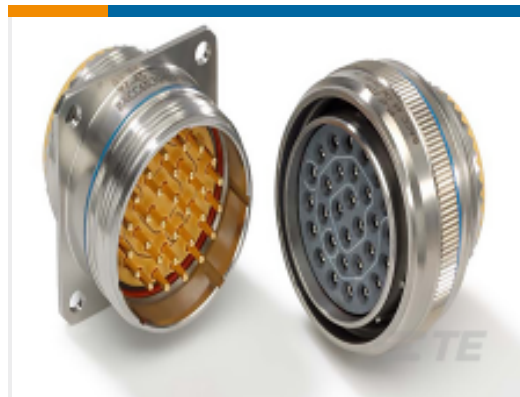
TE 产品编号ZPF000000000008834 983-6SE 14-07 PN