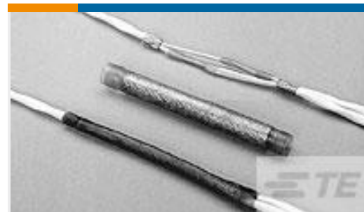
TE 产品编号682035-000 D-150-0177