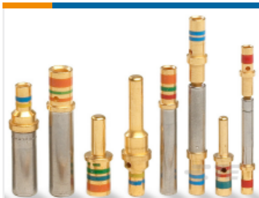
TE 产品编号0641-1-2031L CONT PIN