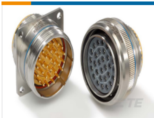
TE 产品编号ZPF000000000008761 983-6SE 10-06 S6