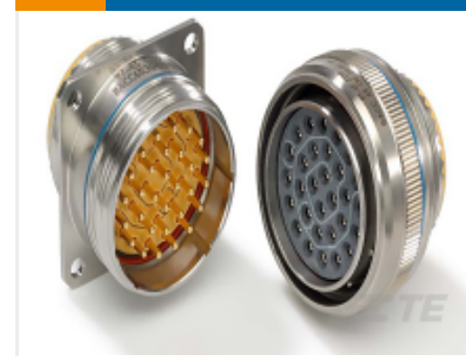
TE 产品编号ZPF000000000008632 983-6S 16-24 SN