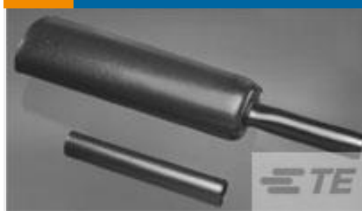
TE 产品编号C71645-000 RMW-10/3-1200/ADH-0