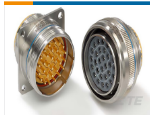
TE 产品编号ZPF000000000007655 983-0SE 20-04 PN-L