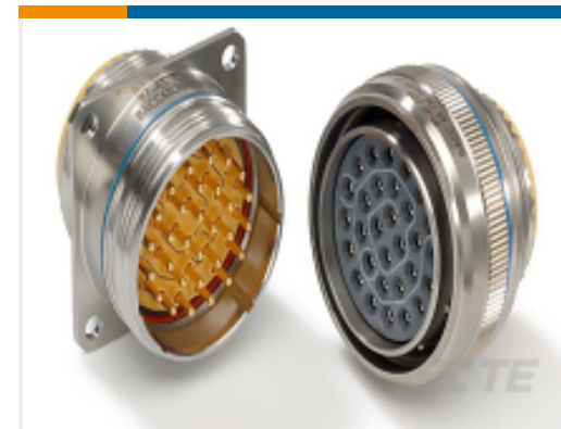
TE 产品编号ZPF0000000000039377 983-7SE 08-03 S6 L