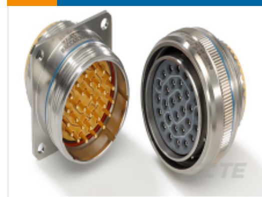
TE 产品编号ZPF000000000007444 983-0S 22-55 SN