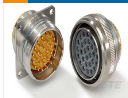
TE 产品编号ZPF000000000033672 983-0SE 14-12 SN