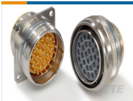
TE 产品编号ZPF000000000009143 983-7SE 16-24 SN-L