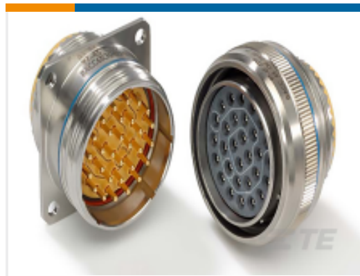
TE 产品编号ZPF0000000000039682 983-7SE 20-25 PN