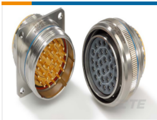
TE 产品编号ZPF0000000000202715 983-7SE 12-21 PN