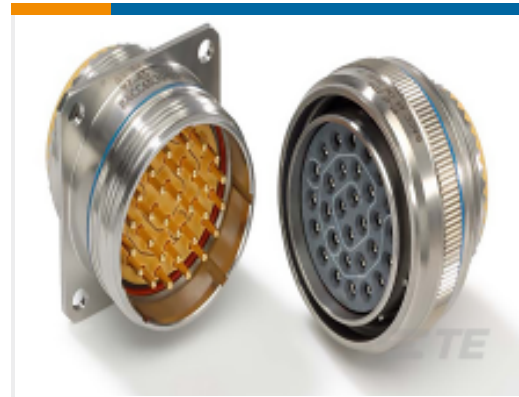
TE 产品编号ZPF000000000038461 983-7RS 14-07 SN