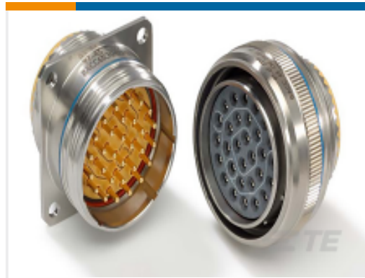
TE 产品编号ZPF000000000009137 983-7SE 12-12 PN