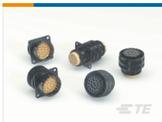
TE 产品编号ZPF0000000000019308 FDBA 56-14-19 SN-K-A246