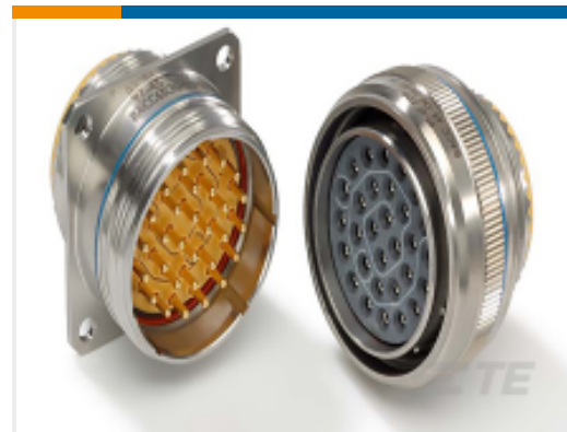
TE 产品编号ZPF0000000000037036 983-6SE 18-08 SN-L