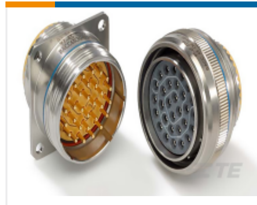
TE 产品编号ZPF000000000008594 983-6S 14-04 PN-L