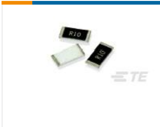
TE 产品编号1-2176057-1 RLP73M 3A R027 1% 1K RL