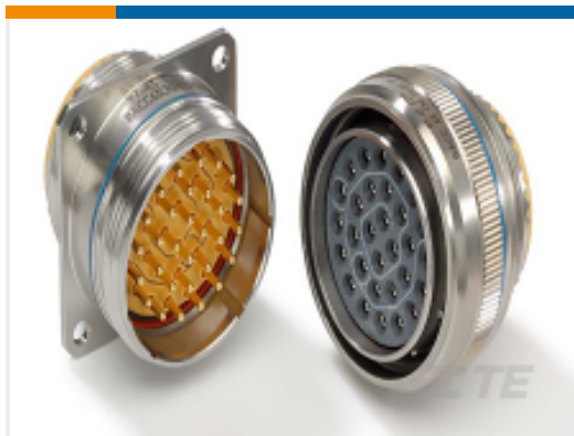
TE 产品编号ZPF000000000008678 983-6S 22-12 PN-L