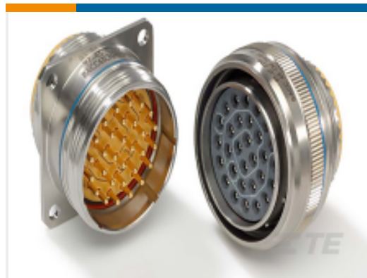
TE 产品编号ZPF000000000008859 983-6SE 14-15 PN-L