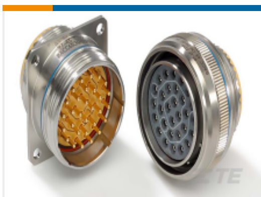
TE 产品编号ZPF000000000009034 983-6SE 24-61 SN-L