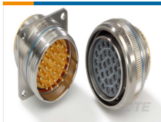
TE 产品编号ZPF0000000000037028 983-6SE 18-08 S6