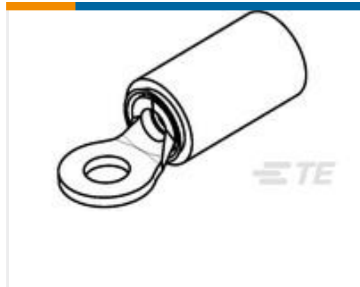
TE 产品编号1577637-1 TERMINAL RT PIDG PEEK STRATO 14-12 AWG