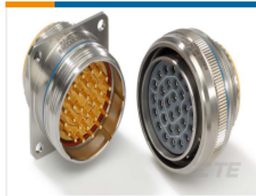
TE 产品编号ZPF000000000008984 983-6SE 22-19 PN-L