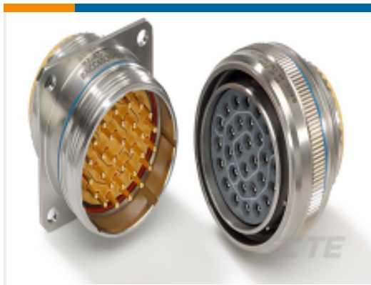
TE 产品编号ZPF000000000008602 983-6S 14-07 PN