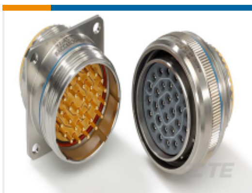
TE 产品编号ZPF000000000037034 983-6SE 18-08 S9