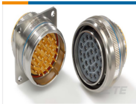
TE 产品编号ZPF000000000008825 983-6SE 14-07 P6