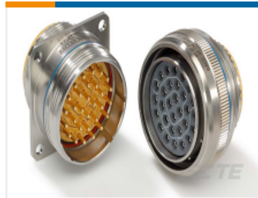
TE 产品编号ZPF00000000007579 983-0SE 14-15 PN