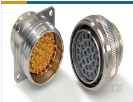
TE 产品编号ZPF000000000008899 983-6SE 16-24 SN