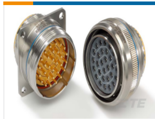
TE 产品编号ZPF000000000037028 983-6SE 18-08 S6