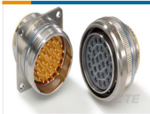
TE 产品编号ZPF000000000122663 983-0S 18-31 P6-A1208