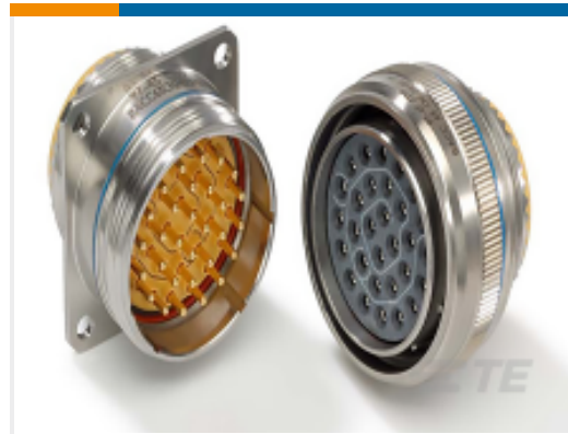
TE 产品编号ZPF00000000106688 983-0S 18-31 PN-A1208