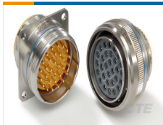
TE 产品编号ZPF000000000037019 983-6SE 18-08 P6