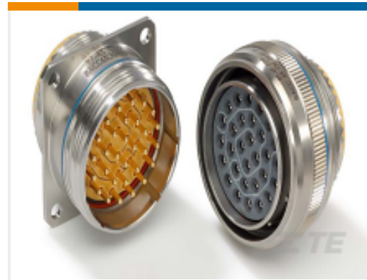
TE 产品编号ZPF000000000122663 983-0S 18-31 P6-A1208