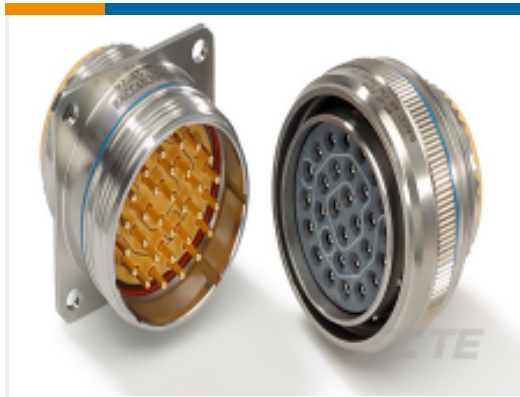
TE 产品编号ZPF000000000008910 983-6SE 18-08 SN