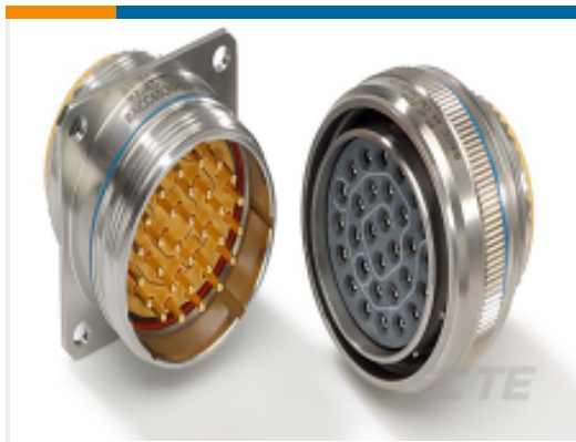
TE 产品编号ZPF000000000007579 983-0SE 14-15 PN