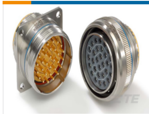
TE 产品编号ZPF000000000037027 983-6SE 18-08 PN