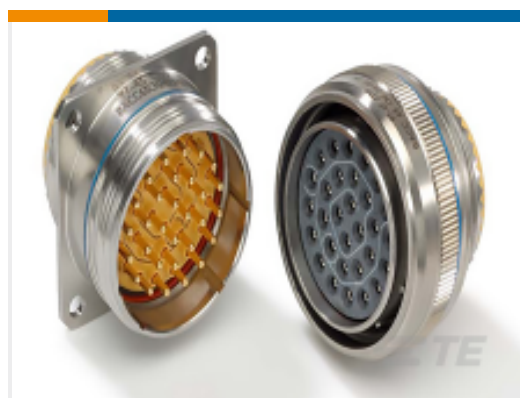
TE 产品编号ZPF000000000037034 983-6SE 18-08 S9