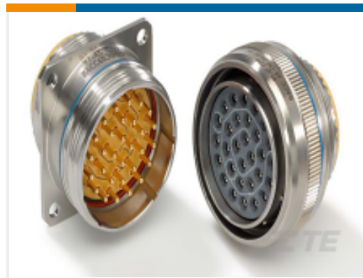
TE 产品编号ZPF000000000008602 983-6S 14-07 PN