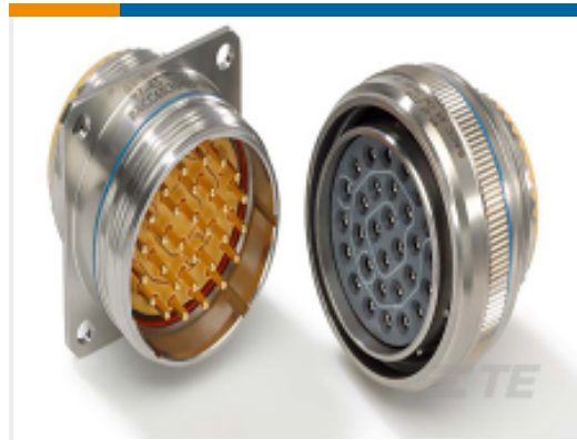
TE 产品编号ZPF000000000008899 983-6SE 16-24 SN