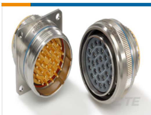
TE 产品编号ZPF000000000037028 983-6SE 18-08 S6