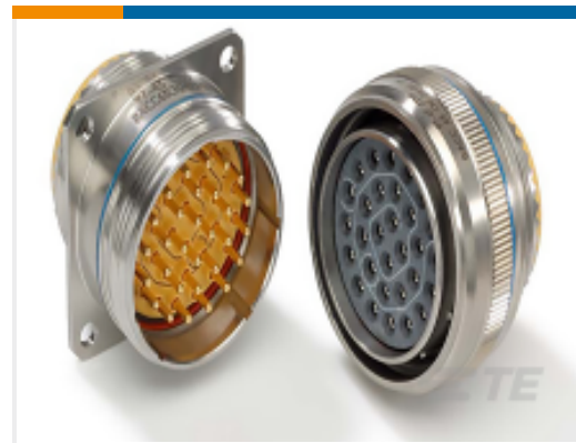
TE 产品编号ZPF000000000008825 983-6SE 14-07 P6