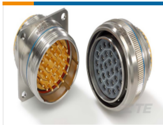
TE 产品编号ZPF000000000033724 983-0SE 18-08 PN