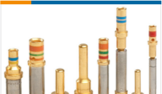
TE 产品编号ZPF00000000003320 65185 A