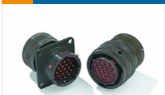
TE 产品编号ZPF000000000006017 951-00 E 8-3A-P 50