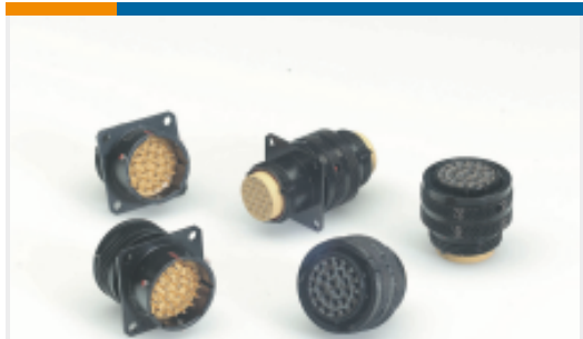
TE 产品编号ZPF000000000019645 FDBA 56-22-55 PN-K