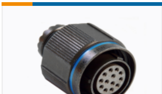
TE 产品编号ZPF000000000017241 DTS 26 W 09-98 SC