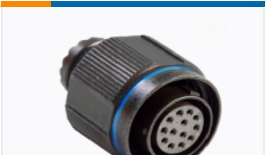
TE 产品编号ZPF000000000017060 DTS 26 F 25-35 PN