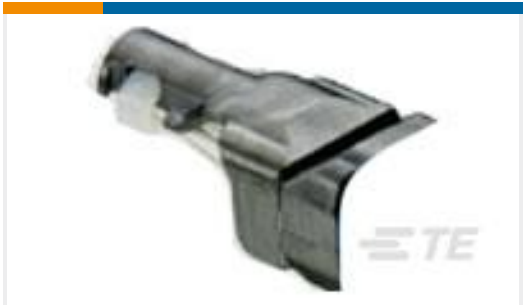
TE 产品编号D369-STB-3 369 3 WAY BACKSHELL STRAIGHT TIE WRAP