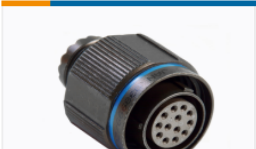
TE 产品编号ZPF000000000017005 DTS 26 F 17-35 SN