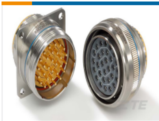
TE 产品编号ZPF000000000036514 983-6S 12-12 S9