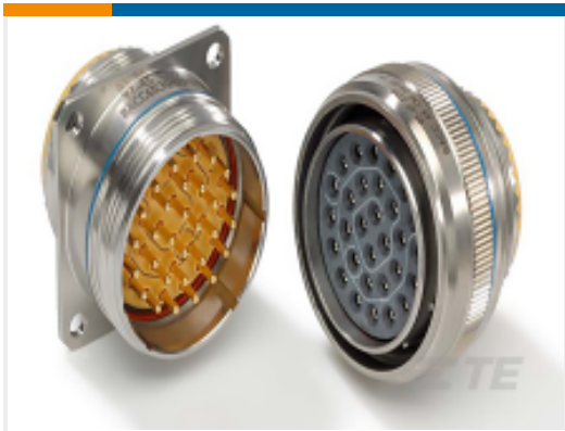
TE 产品编号ZPF00000000008899 983-6SE 16-24 SN