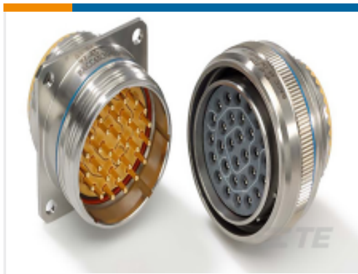
TE 产品编号ZPF00000000007668 983-0SE 20-25 SN