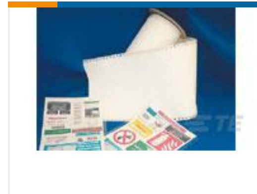
TE 产品编号860137-000 RMK-25X35-A4