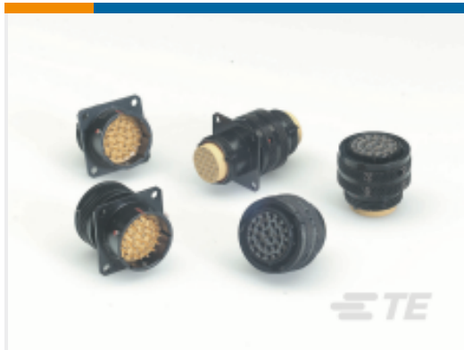
TE 产品编号ZPF000000000017900 FDBA 50-10-6 PN-K