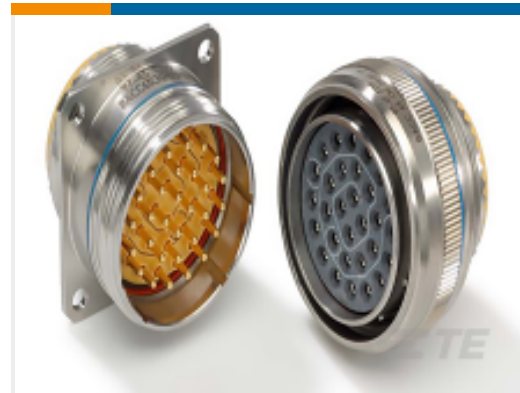
TE 产品编号ZPF000000000007992 983-1Y 08-03 P6