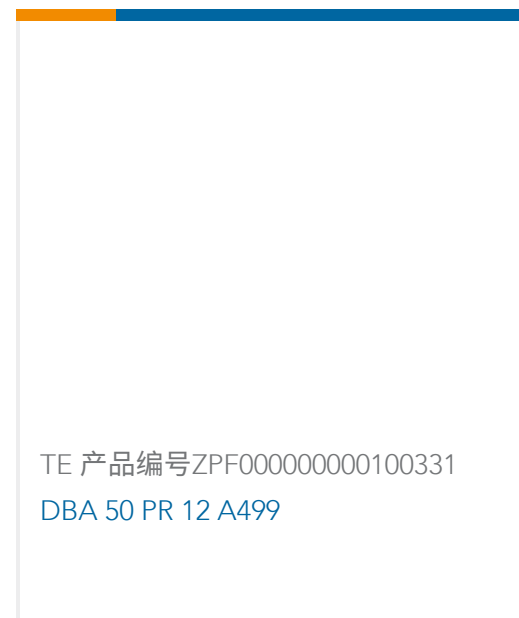
TE 产品编号ZPF0000000000100331 DBA 50 PR 12 A499