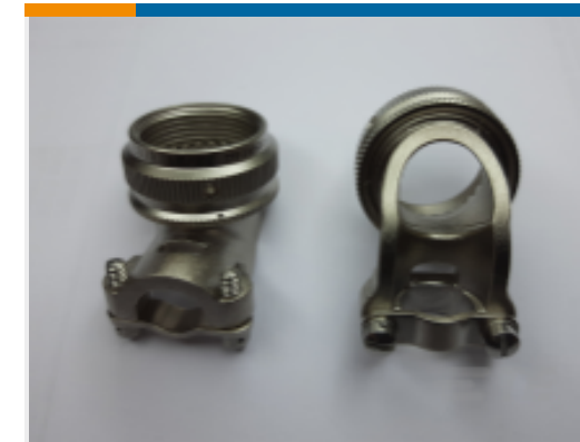
TE 产品编号2275013-9 ASSY,EN3660-005, SS-PA BACKSHELL, SZ24