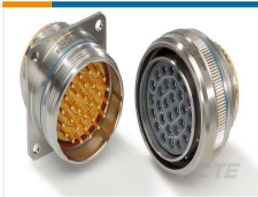
TE 产品编号ZPF000000000008731 983-6SE 08-98 PN-L