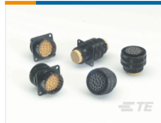
TE 产品编号ZPF000000000019961 FDBA 57-16-26 PW-K 090 A499