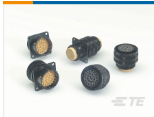
TE 产品编号ZPF000000000018227 FDBA 50-16-21 SN-K 090