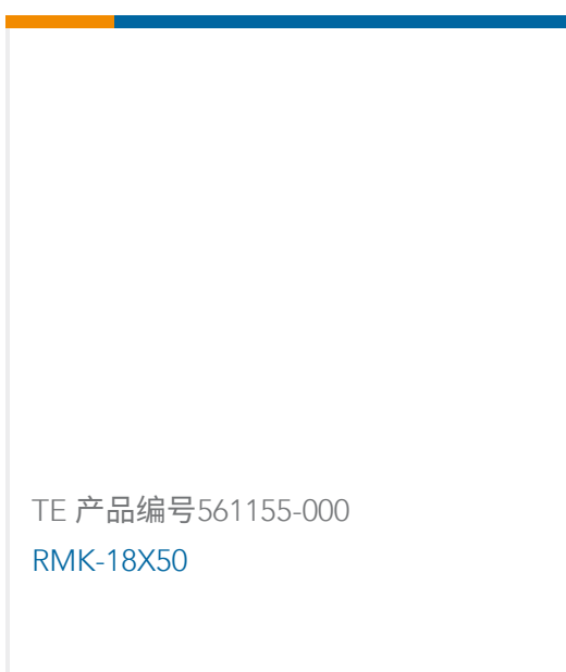
TE 产品编号561155-000 RMK-18X50