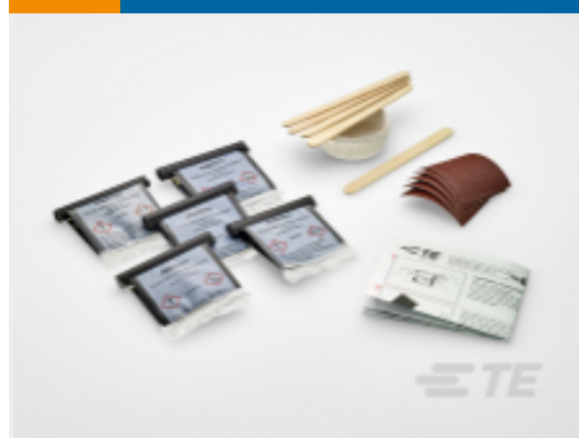
TE 产品编号878462-000 S1125-KIT-1