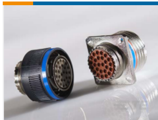
TE 产品编号ZPF000000000138174 DTS 24 S 09-98 UC