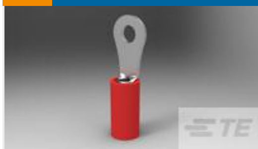
TE 产品编号320553 PIDG R 22-16 COMM 22-18 MIL 4