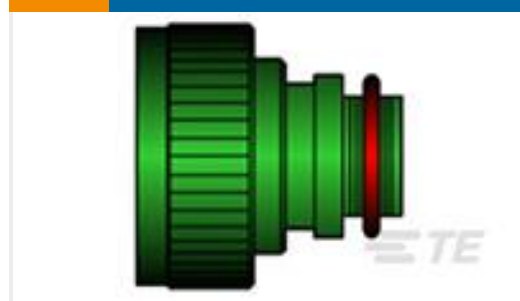
TE 产品编号658819-000 TXR40AB00-1006AI