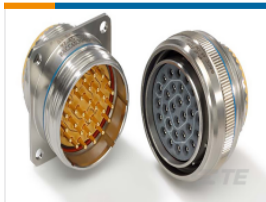
TE 产品编号ZPF000000000149093 983-0Y 10-12 P6