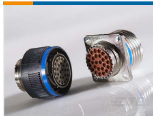
TE 产品编号ZPF000000000138169 DTS 24 S 11-35 UN