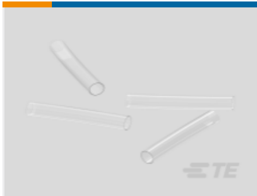
TE 产品编号CV25852001 RW-175-E 热缩管