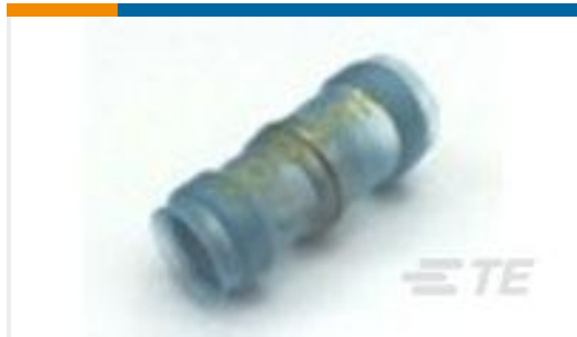
TE 产品编号695181-000 B-023-04