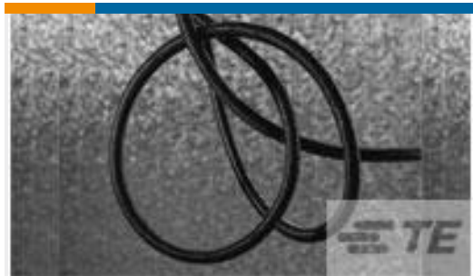
TE 产品编号5470224008 CONVOLEX-3/8-0-SP