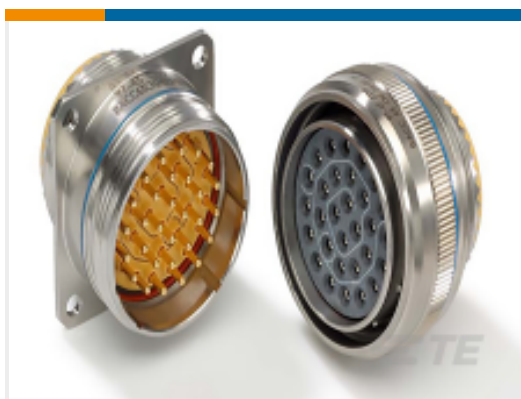
TE 产品编号ZPF00000000033298 983-0S 16-24 P8