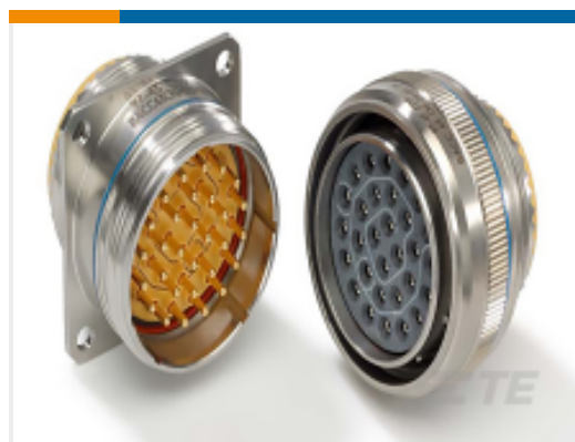
TE 产品编号ZPF00000000036603 983-6S 16-24 S8