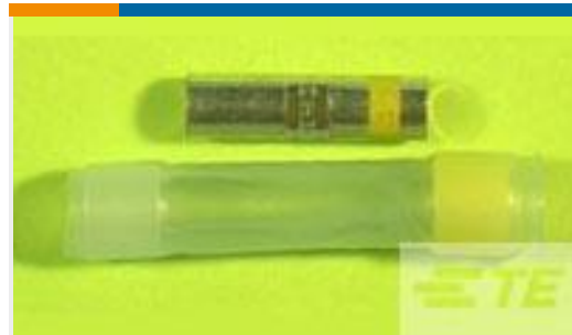
TE 产品编号695051-000 W-096-02