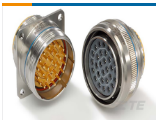
TE 产品编号ZPF00000000036602 983-6S 16-24 S7