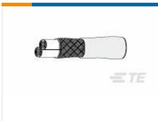
TE 产品编号382287-000 44A1121-20-2/6-9