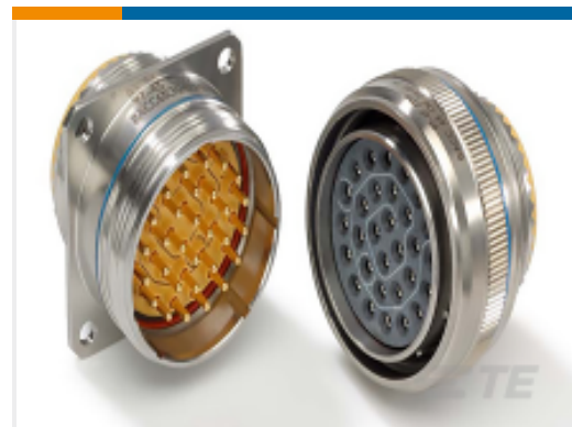
TE 产品编号ZPF0000000000007174 983-ORS 08-98 PN