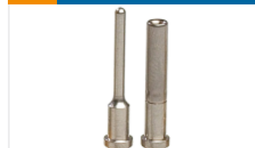
TE 产品编号ZPF0000000000001261 097-0267-16 A1267