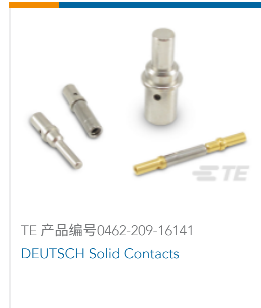
TE 产品编号0462-209-16141 DEUTSCH Solid Contacts