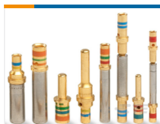
TE 产品编号 ZPF0000000000001201 097-0015-20