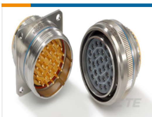
TE 产品编号ZPF000000000007308 983-0S 08-03 PN