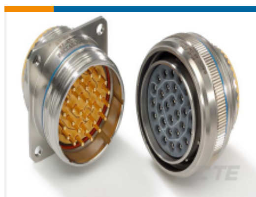
TE 产品编号ZPF000000000007385 983-0S 16-24 P6