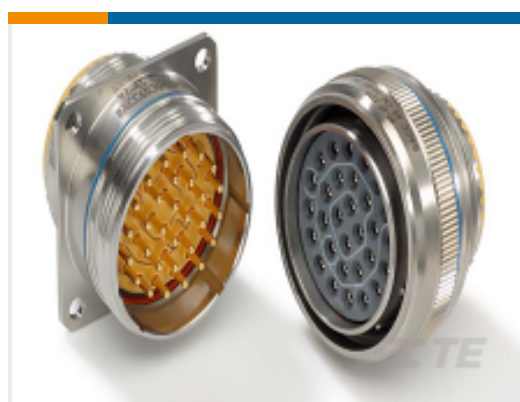
TE 产品编号ZPF000000000007373 983-0S 14-15 P6