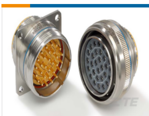
TE 产品编号ZPF000000000008526 983-6S 08-03 SN