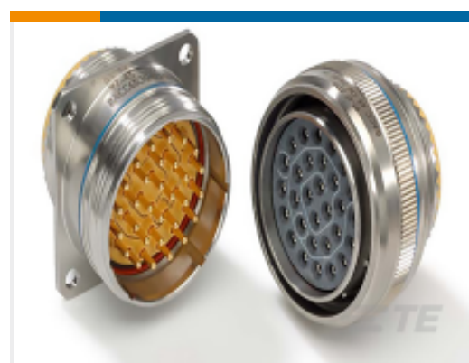
TE 产品编号ZPF000000000007446 983-0S 24-30 SN