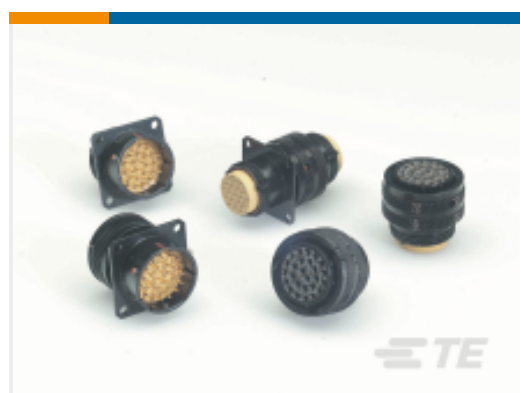
TE 产品编号 ZPF000000000019479 FDDBA 56-18-32 SW-K 090