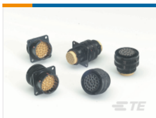
TE 产品编号 ZPF000000000019405 FDDBA 56-16-26 SW-K 090