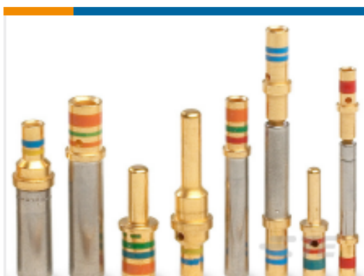
TE 产品编号 ZPF00000000000571 020-0511-22