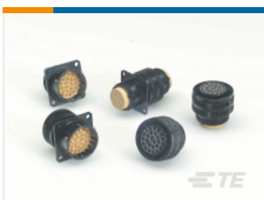
TE 产品编号 ZPF000000000019859 FDDBA 57-12-10 PW-K 090 A499