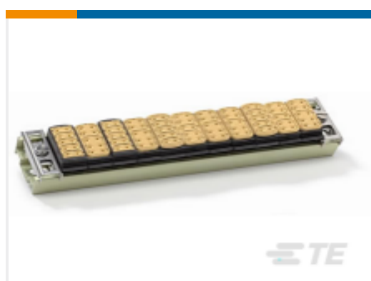
TE 产品编号 ZPF000000000020164 FMJ 12D 22-02