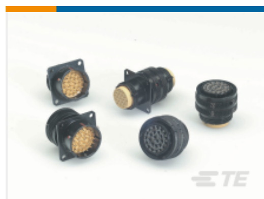
TE 产品编号 ZPF000000000019520 FDDBA 56-20-39 PN-K 090