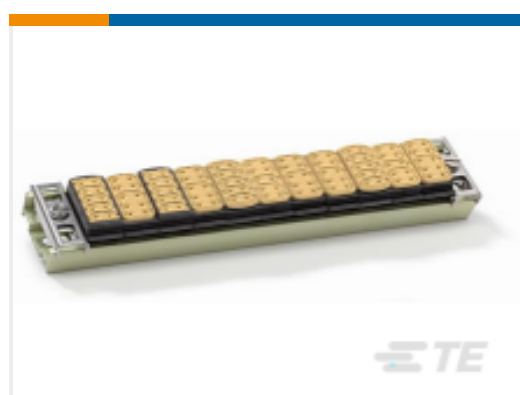
TE 产品编号 ZPF000000000020168 FMJ 12D 22-06