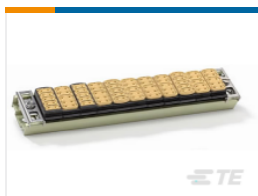
TE 产品编号 ZPF000000000020171 FMJ 12E 22-03