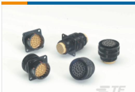
TE 产品编号 ZPF00000000000019464 FDBA 56-18-32 SN-K 090