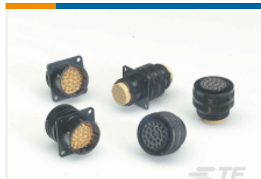
TE 产品编号 ZPF00000000000019868 FDBA 57-12-10 SW-K 090 A499