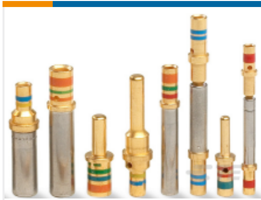
TE 产品编号 ZPF0000000000000570 020-0511-20