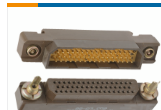
TE 产品编号 ZPF00000000000017863 FAST-E 01 F-X-A 00 A