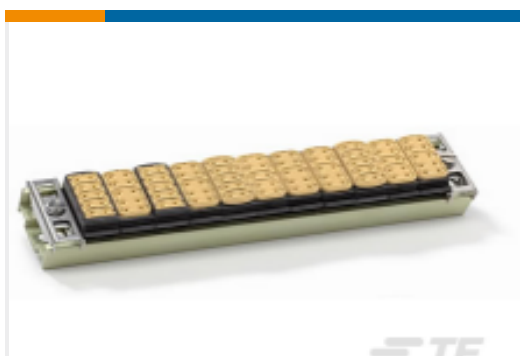
TE 产品编号 ZPF00000000000020134 FMJ 11E 16-01 K