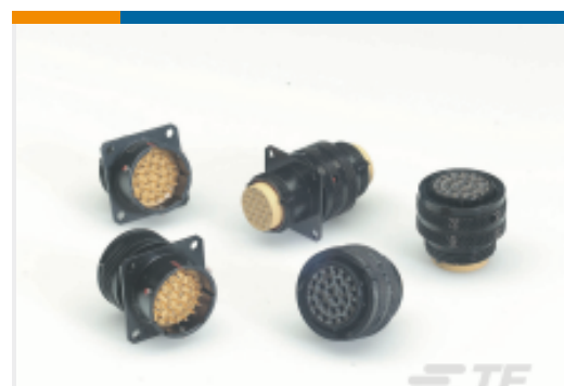
TE 产品编号 ZPF00000000000019395 FDBA 56-16-26 SN-K 090