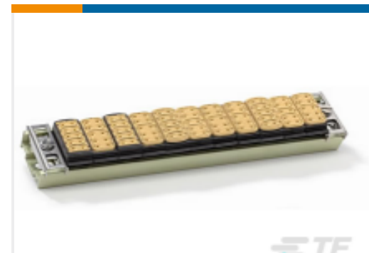
TE 产品编号 ZPF00000000000020172 FMJ 12E 22-04