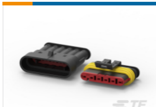
TE 产品编号282104-1 AMP SUPERSEAL 1.5MM，连接器壳体