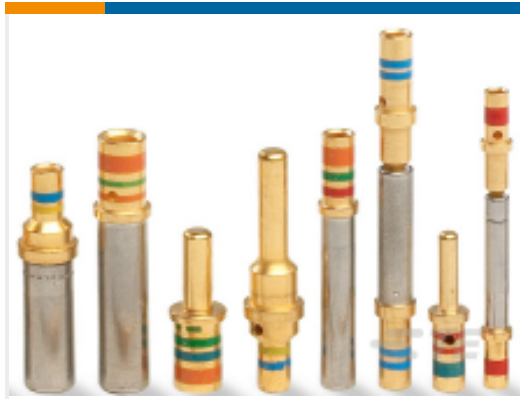
TE 产品编号 ZPF000000000000570 020-0511-20