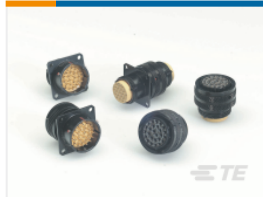
TE 产品编号ZPF000000000020039 FDBA 57-22-55 PN-K-A5610