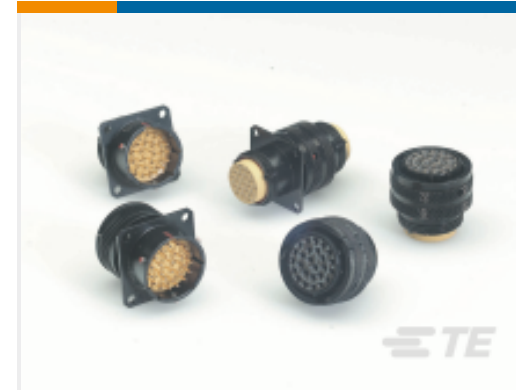
TE 产品编号ZPF000000000020097 FDBA 57-8-98 SN-K-A5610