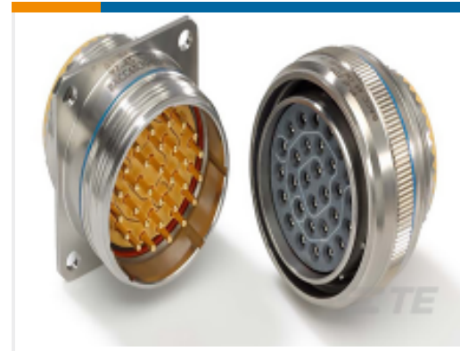
TE 产品编号ZPF000000000008227 983-6KE 12-03 SN-L