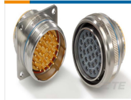
TE 产品编号ZPF000000000008322 983-6R 12-03 S7