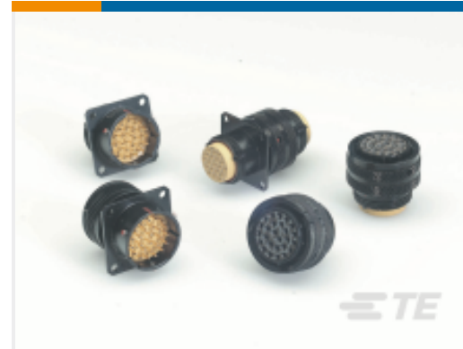
TE 产品编号ZPF000000000020089 FDBA 57-8-3A-SN-K-A5610