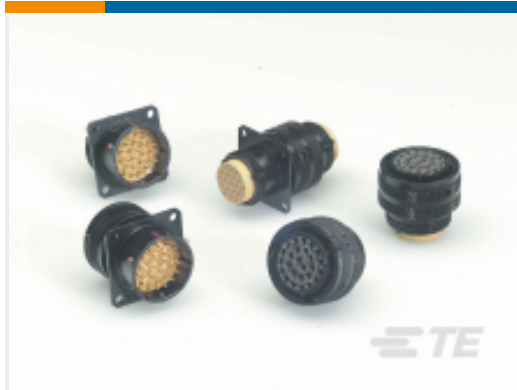
TE 产品编号ZPF000000000019232 FDBA 56-14-12 PN-K-B246