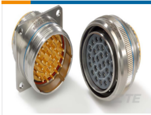
TE 产品编号ZPF000000000007498 983-0SE 10-05 SN-L