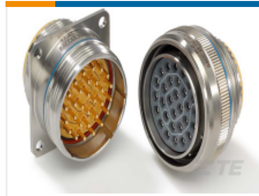
TE 产品编号ZPF000000000007575 983-0SE 14-07 SN-L