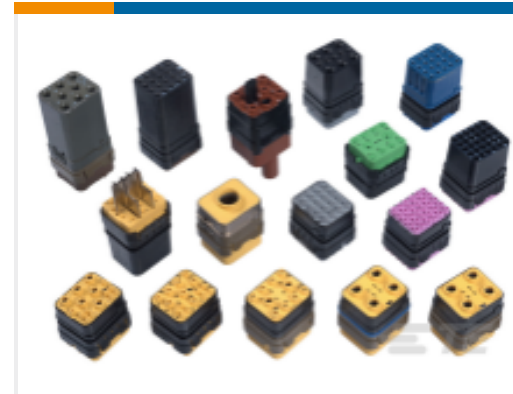
TE 产品编号ZPF00000000015262 DMC-M 12-20 BN