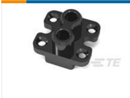
TE 产品编号1648575-1 296-0041-01100