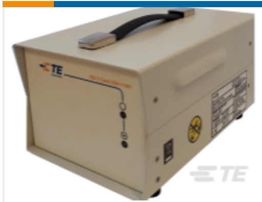
TE 产品编号CF0026-000 ED-7-CONT-230/110V-MK4