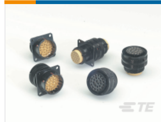
TE 产品编号ZPF00000000018321 FDBA 50-18-32 PX-K