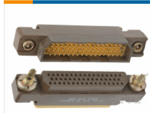
TE 产品编号ZPF00000000017838 FAST-D 01 F-X-B 00 A