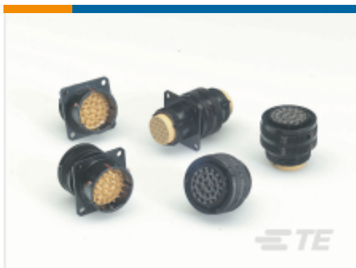
TE 产品编号ZPF00000000018602 FDBA 50-24-61 PW-K-A499