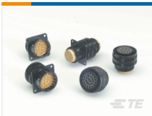
TE 产品编号ZPF00000000019335 FDBA 56-14-19 SY-K