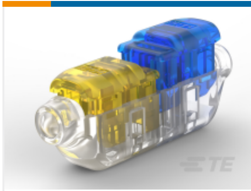
TE 产品编号2213600-4 COOLSPLICE LW 12/14 TO 14/16 AWG