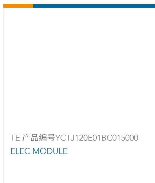
TE 产品编号YCTJ120E01BC015000 ELEC MODULE