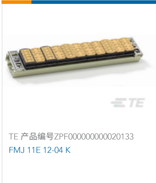
TE 产品编号ZPF00000000020133 FMJ 11E 12-04 K