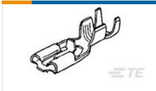
TE 产品编号170331-1 PL MKII 187 REC 20-16AWG PTBR LP