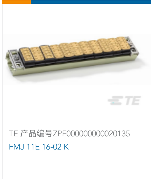
TE 产品编号ZPF00000000020135 FMJ 11E 16-02 K