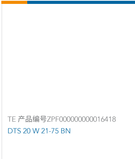
TE 产品编号ZPF00000000016418 DTS 20 W 21-75 BN