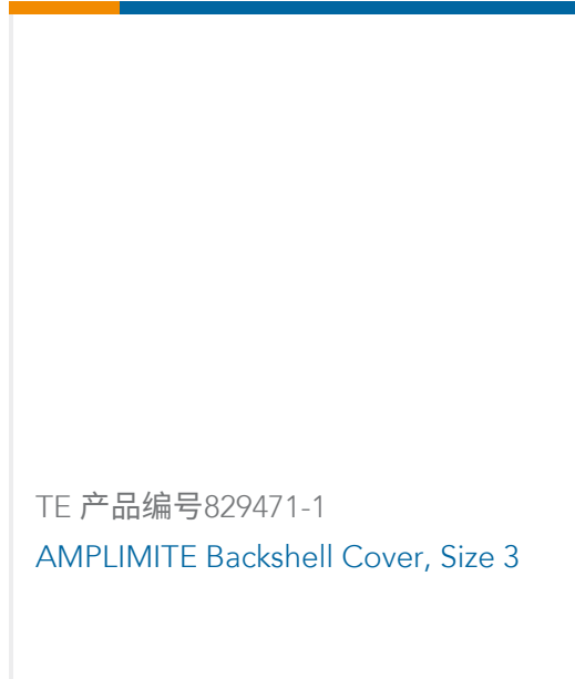
TE 产品编号829471-1 AMPLIMITE Backshell Cover, Size 3