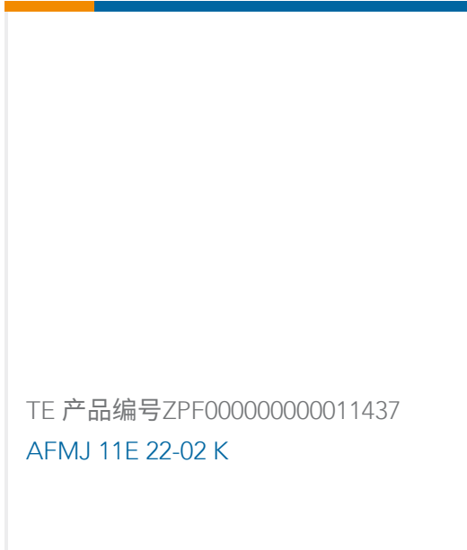
TE 产品编号ZPF00000000011437 AFMJ 11E 22-02 K