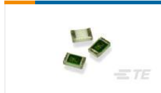
TE 产品编号1-1879208-7 CPF 0402 47R 0.1% 25PPM 1K RL