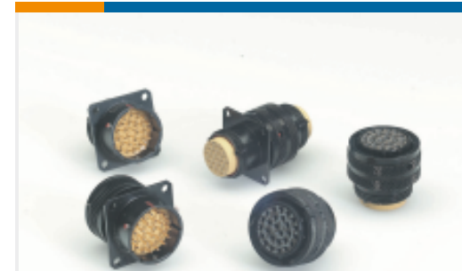
TE 产品编号ZPF000000000019041 FDBA 54-8-3A-PN-K-A246