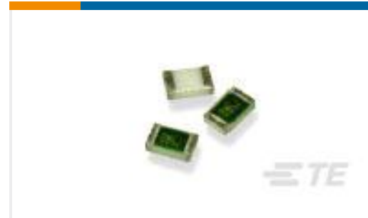
TE 产品编号1614885-2 CPF0805 100R 0.1% 25PPM 5K RL