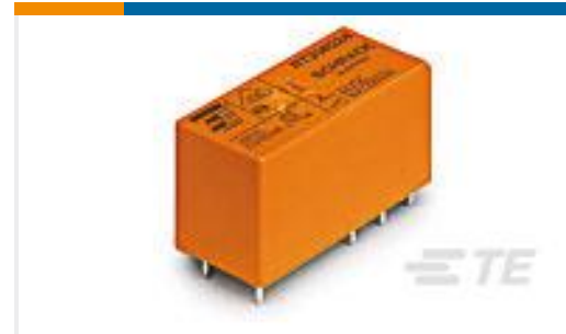
TE 产品编号5-1393243-4 RT424F12