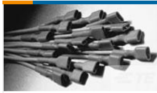
TE 产品编号5913834003 LSTT-6.4-0-SP