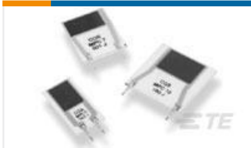
TE 产品编号1-1623776-5 MPC5 50R 5%