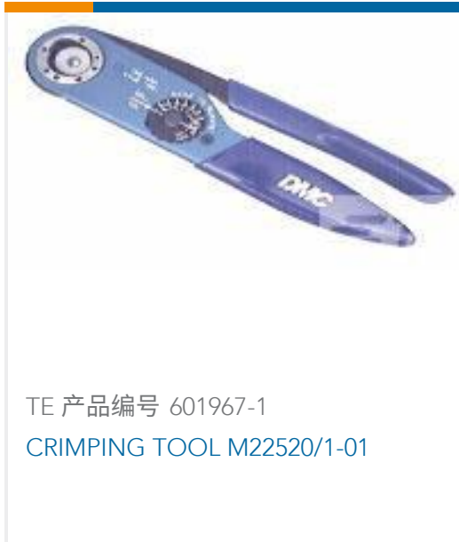
TE 产品编号 601967-1 CRIMPING TOOL M22520/1-01