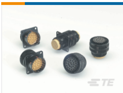
TE 产品编号 ZPF000000000019805 FDBA 56-8-3A-SN-K