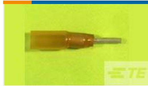
TE 产品编号695124-000 B-801-16