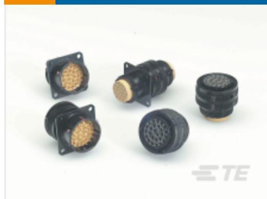
TE 产品编号ZPF000000000017917 FDBA 50-10-6 PW-K 090