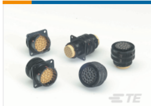
TE 产品编号ZPF000000000017903 FDBA 50-10-6 PN-K 090