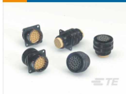
TE 产品编号ZPF000000000019038 FDBA 54-8-3A-PN-K