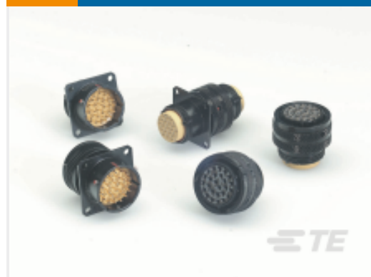
TE 产品编号ZPF000000000017963 FDBA 50-12-10 PW-K 090