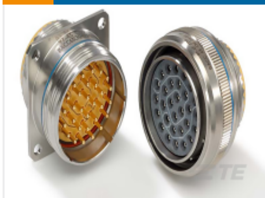
TE 产品编号ZPF000000000009109 983-7RS 10-06 PN