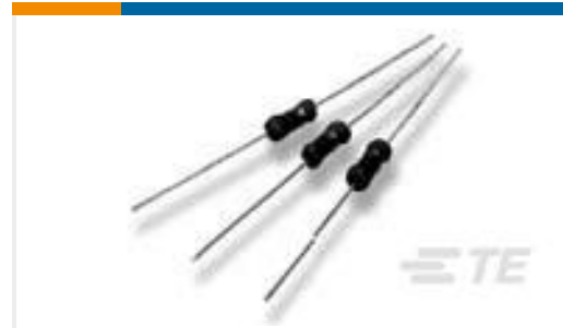
TE 产品编号4-1625892-4 3W SM M/OX 5% 390R