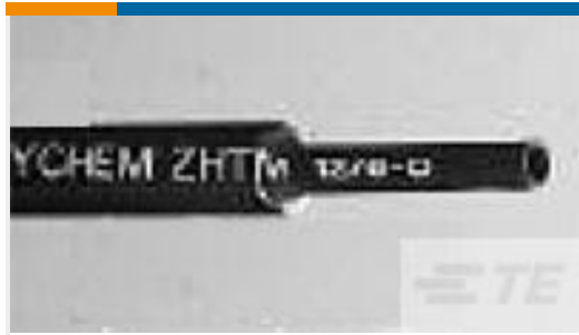
TE 产品编号2450984003 ZHTM-40/20-0-SP