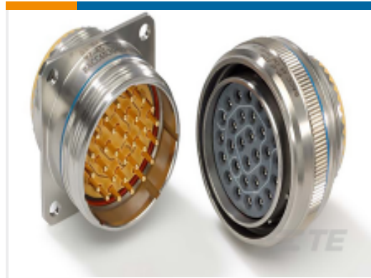
TE 产品编号ZPF000000000007556 983-0SE 14-04 PN