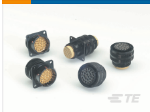
TE 产品编号ZPF000000000098678 FDBA 50-14-19 PN-K-A6204