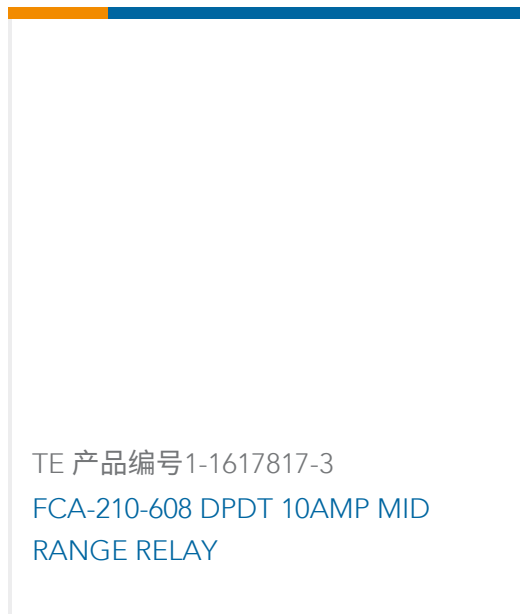
TE 产品编号1-1617817-3 FCA-210-608 DPDT 10AMP MID RANGE RELAY