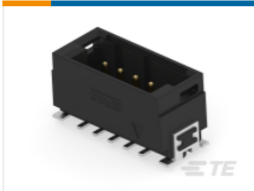
TE 产品编号474006-E DRCQ 2,54 10 M * SMD * 137 E012 094 GU-H