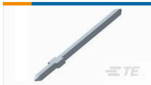
TE 产品编号1-928776-5 MOD2 STIFT M A-PIN