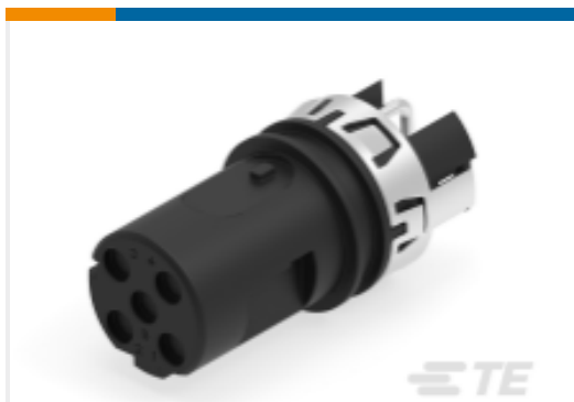
TE 产品编号225284-E M12 FEMALE, D CODE, RA, 4P THR REAR MOUNT