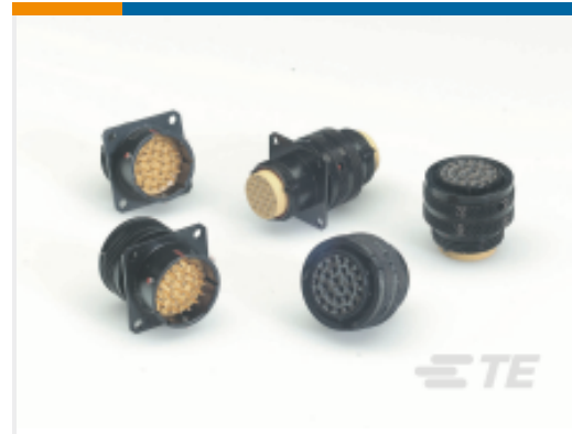
TE 产品编号ZPF0000000000202613 FDBA 50-12-10 SN-K-A1025