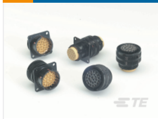
TE 产品编号ZPF000000000018586 FDBA 50-24-61 PN-K 090