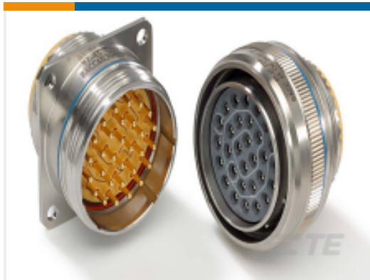
TE 产品编号ZPF100000000008316 983-6R 10-05 SN-L