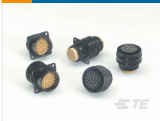
TE 产品编号ZPF0000000000202614 FDBA 50-14-19 PN-K-A1025