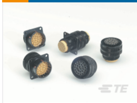
TE 产品编号ZPF000000000018217 FDBA 50-14-5 SN-K 090 A231