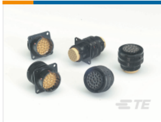
TE 产品编号ZPF000000000019021 FDBA 54-22-55 SN-K 090