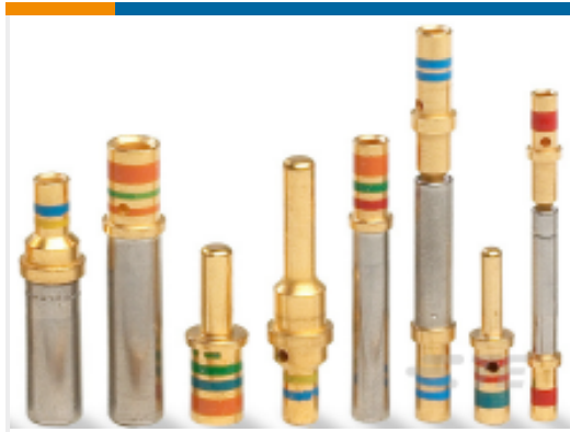
TE 产品编号ZPF00000000001930 182-0118-20