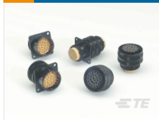
TE 产品编号ZPF000000000018615 FDBA 50-24-61 PY-K 090