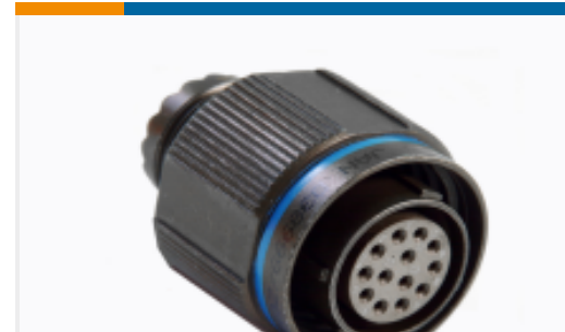
TE 产品编号ZPF00000000016982 DTS 26 F 17-06 SN