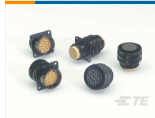
TE 产品编号ZPF000000000018507 FDBA 50-22-55 PN-K 090 A499