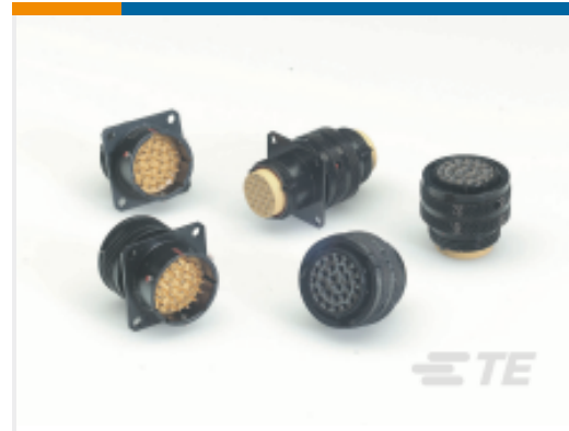
TE 产品编号ZPF000000000018227 FDBA 50-16-21 SN-K 090