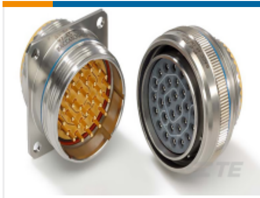
TE 产品编号ZPF000000000008768 983-6SE 10-06 SN-L