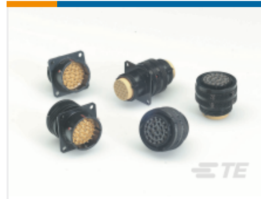
TE 产品编号ZPF000000000018330 FDBA 50-18-32 SN-K 090