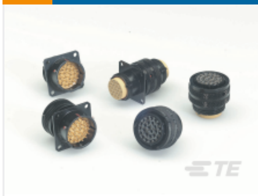
TE 产品编号ZPF000000000018586 FDBA 50-24-61 PN-K 090