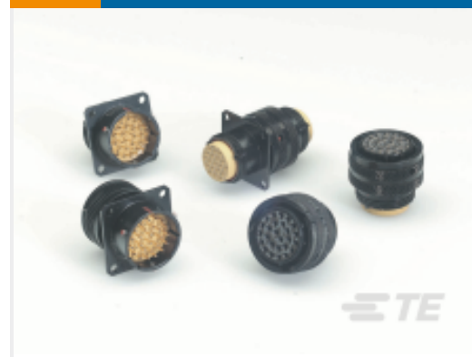
TE 产品编号ZPF000000000019229 FDBA 56-14-12 PN-K 090