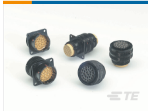
TE 产品编号ZPF000000000017979 FDBA 50-12-10 SN-K