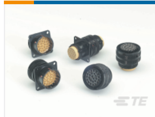
TE 产品编号ZPF000000000017900 FDBA 50-10-6 PN-K