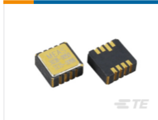
TE 产品编号3038-0050-03 3038 ACCELEROMETER