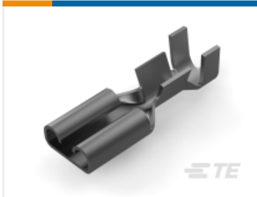
TE 产品编号182485-4 FF 187 REC 0.5-1.5MM2 TPPB LP