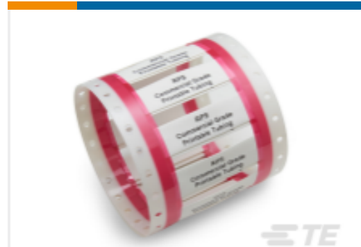
TE 产品编号3979470001 RPS Commercial Grade Sleeves