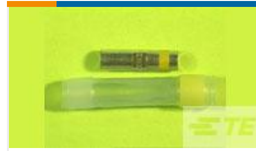
TE 产品编号650075-000 D-436-37