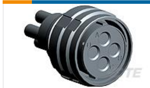
TE 产品编号1811902-7 PLUG,N KEY,SZ 19,FREE HANGING