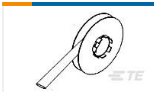
TE 产品编号997183-000 TTMS-3.2-9