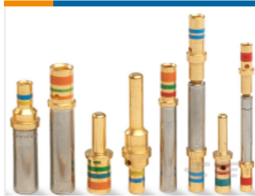
TE 产品编号ZPF0000000000003594 724-0001-22