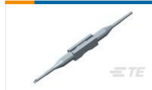
TE 产品编号110219-000 CTA-1160