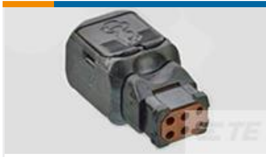
TE 产品编号D369-P66-NS0 369 6 WAY PLUG, NO CONTACTS, SKT