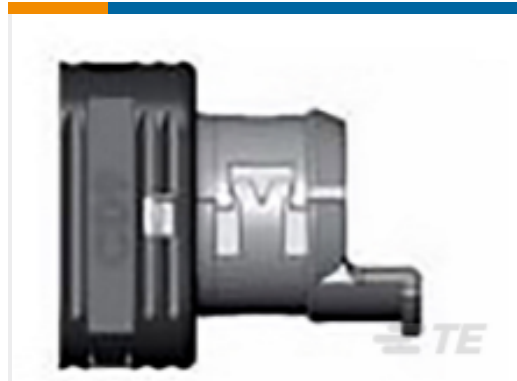
TE 产品编号ZPF000000000137993 787-8055-13M