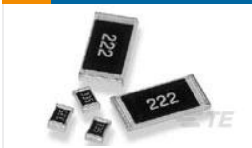
TE 产品编号 1622866-1 CRG0603 1% 1K0