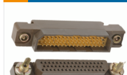
TE 产品编号 ZPF00000000017864 FAST-E 01 F-X-A 00 B