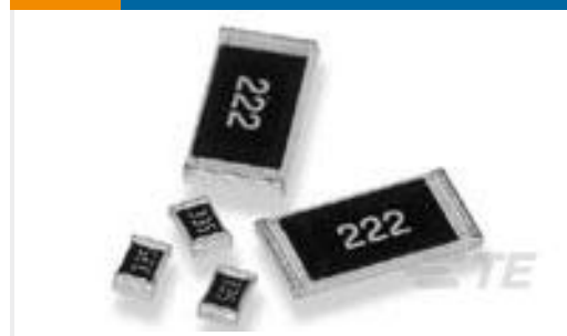
TE 产品编号 1623094-1 CRG0603 ZEROHM