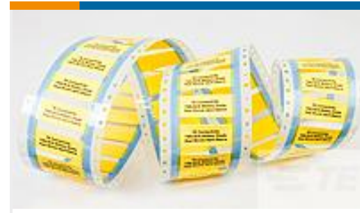
TE 产品编号 6632750001 TMS-SCE-3/32-2.0-9