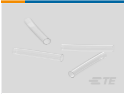
TE 产品编号 CV25382001 RW-175-E 热缩管