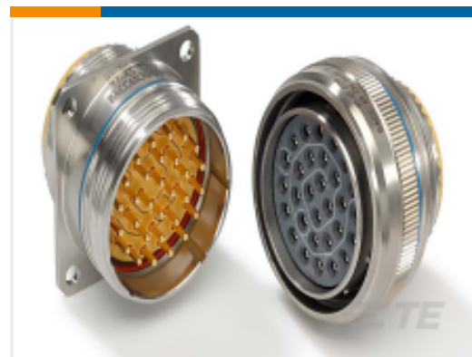
TE 产品编号ZPF000000000008196 983-6KE 10-05 PN