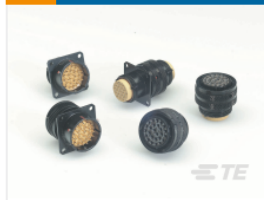
TE 产品编号ZPF0000000000018141 FDBA 50-14-19 PW-K 090