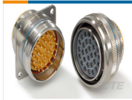
TE 产品编号ZPF000000000007175 983-ORS 10-05 P6