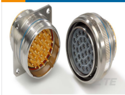
TE 产品编号ZPF000000000008954 983-6SE 20-25 PN