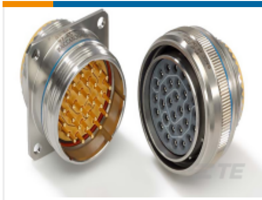
TE 产品编号ZPF000000000008115 983-6K 14-07 SN-L