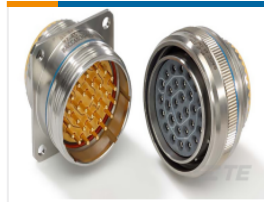
TE 产品编号ZPF0000000000036123 983-6RS 14-15 P6