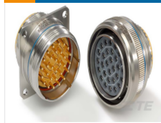
TE 产品编号ZPF100000000008795 983-6SE 12-12 P6 L