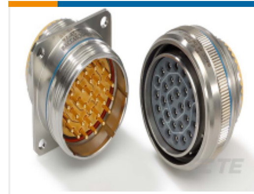
TE 产品编号ZPF000000000008859 983-6SE 14-15 PN-L