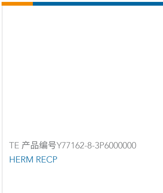
TE 产品编号Y77162-8-3P6000000 HERM RECP