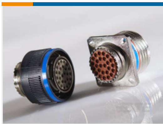
TE 产品编号ZPF000000000017195 DTS 26 S 17-26 SN