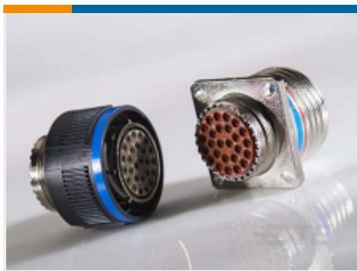
TE 产品编号ZPF000000000017198 DTS 26 S 19-32 SA