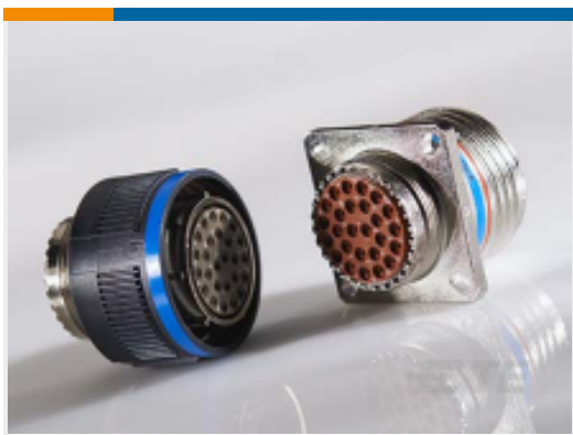
TE 产品编号ZPF000000000017207 DTS 26 S 23-53 SE