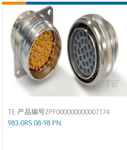
TE 产品编号ZPF00000000000007174 983-ORS 08-98 PN