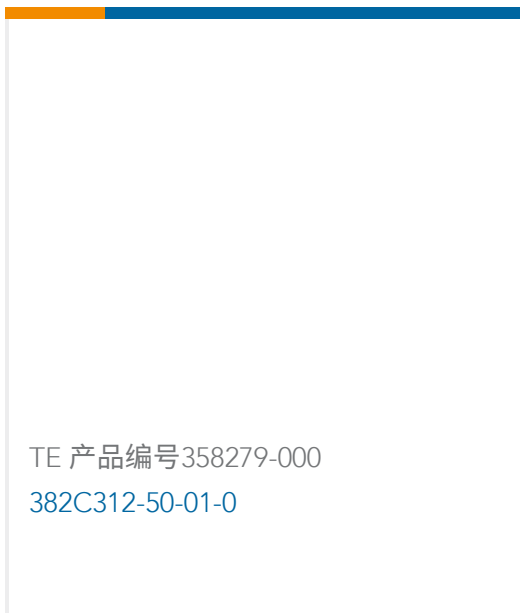
TE 产品编号358279-000 382C312-50-01-0