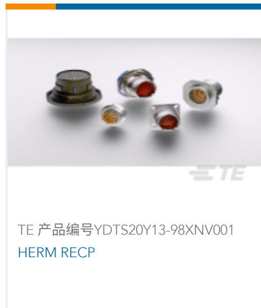
TE 产品编号YDTS20Y13-98XNV001 HERM RECP