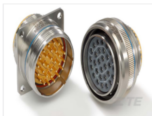
TE 产品编号ZPF000000000007174 983-ORS 08-98 PN