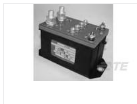
TE 产品编号1616058-6 A703CD (FAA/PMA)=RELAY