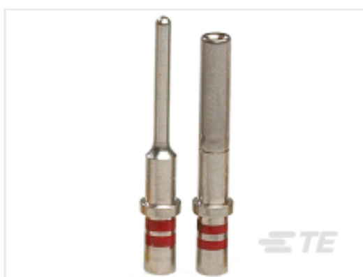
TE 产品编号ZPF000000000001261 097-0267-16 A1267