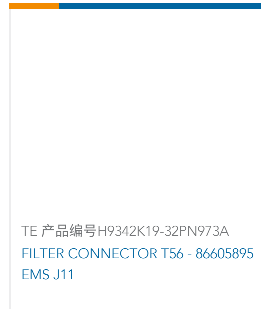
TE 产品编号H9342K19-32PN973A FILTER CONNECTOR T56 - 86605895 EMS J11