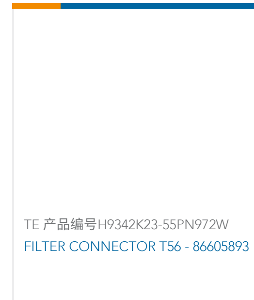
TE 产品编号H9342K23-55PN972W FILTER CONNECTOR T56 - 86605893