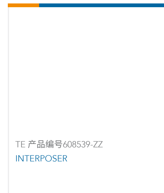
TE 产品编号608539-ZZ INTERPOSER