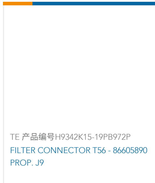
TE 产品编号H9342K15-19PB972P FILTER CONNECTOR T56 - 86605890 PROP. J9