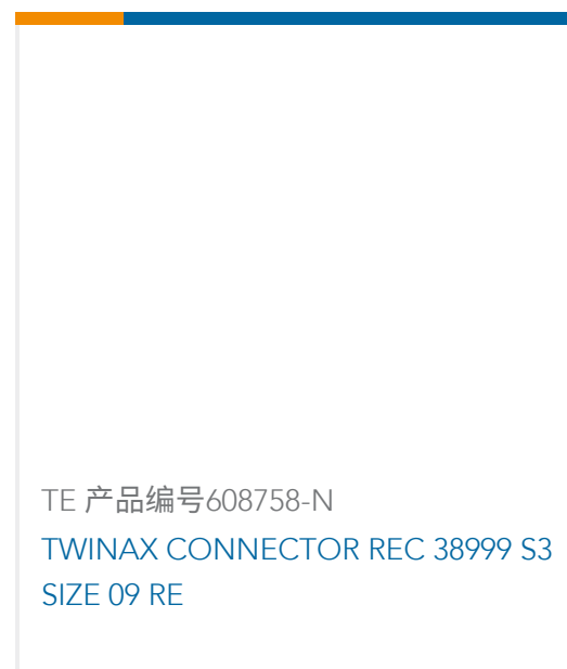
TE 产品编号608758-N TWINAX CONNECTOR REC 38999 S3 SIZE 09 RE