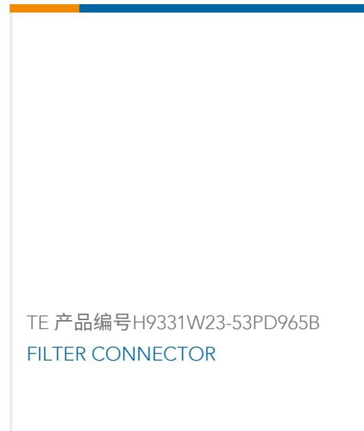
TE 产品编号H9331W23-53PD965B FILTER CONNECTOR