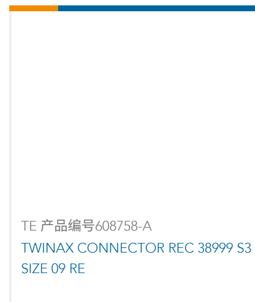
TE 产品编号608758-A TWINAX CONNECTOR REC 38999 S3 SIZE 09 RE