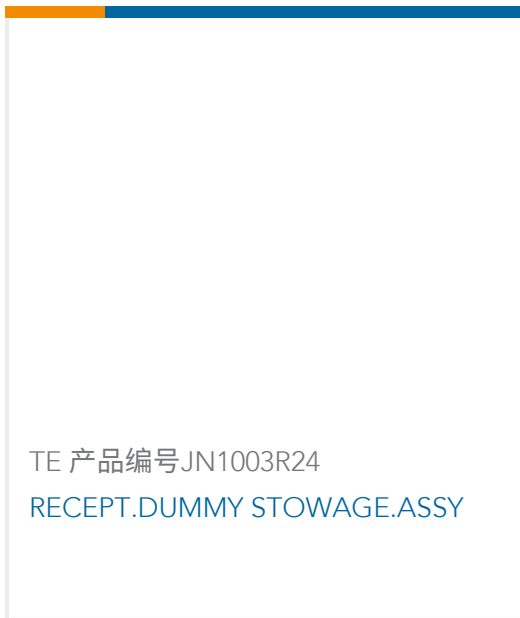
TE 产品编号JN1003R24 RECEPT.DUMMY STOWAGE.ASSY