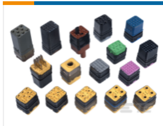
TE 产品编号ZPF000000000015303 DMC-M 20-22 PB