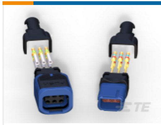
TE 产品编号YD369-P99-BP3-0000 369 9 WAY PLUG, 20/22 CONTACTS, PIN