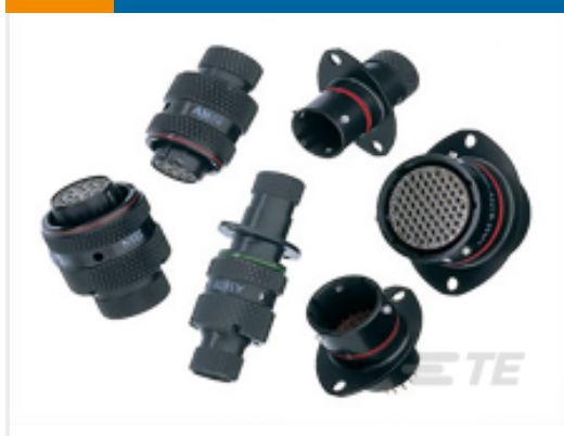
TE 产品编号AS110-98PN-913F RECEPT.CABLE COUP.TYPE 1 CAD PLATE