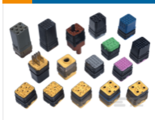
TE 产品编号ZPF000000000015312 DMC-M 20-22 SB