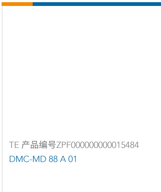
TE 产品编号ZPF00000000000015484 DMC-MD 88 A 01