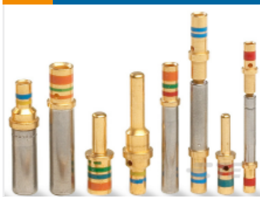
TE 产品编号ZPF0000000000003627 724-1064-12