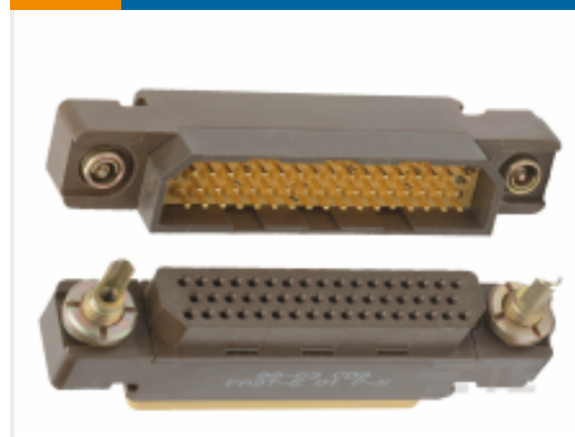
TE 产品编号ZPF00000000000017863 FAST-E 01 F-X-A 00 A