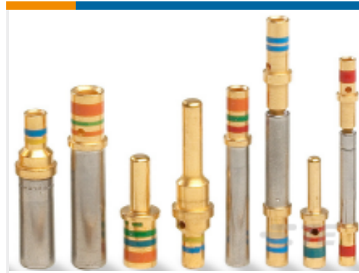
TE 产品编号ZPF0000000000001930 182-0118-20