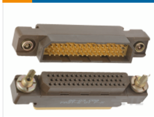
TE 产品编号ZPF00000000000017843 FAST-D 01 M-X-B 00 A