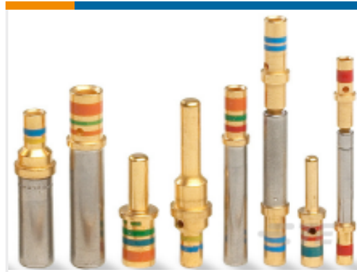
TE 产品编号ZPF000000000000571 020-0511-22