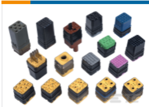
TE 产品编号ZPF000000000136704 DMC-M 99-10 BN