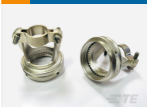
TE 产品编号2275011-8 ASSY,EN3660-004, SS-PA BACKSHELL, SZ22