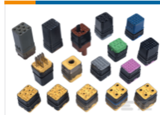
TE 产品编号ZPF00000000015216 DMC-M 08-16 AC