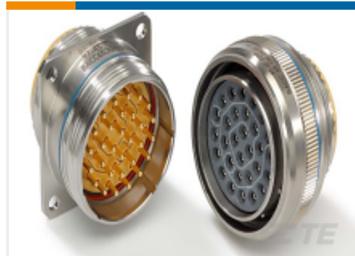
TE 产品编号ZPF00000000009045 983-6SE 28-06 SN-L-A1325