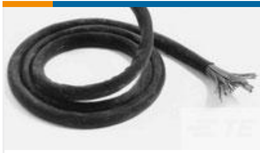
TE 产品编号5580614002 VPB-1-1/4-0-SP