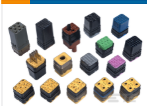
TE 产品编号ZPF000000000137236 DMC-MA 20-22 AD