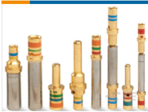
TE 产品编号 ZPF000000000002008 182-0655-12