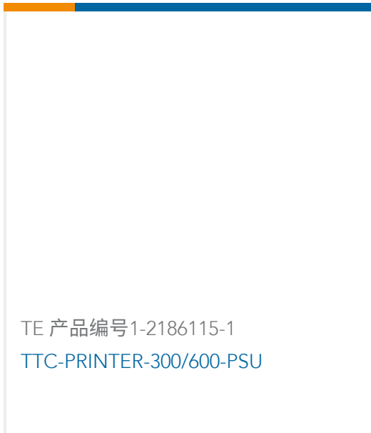
TE 产品编号 1-2186115-1 TTC-PRINTER-300/600-PSU