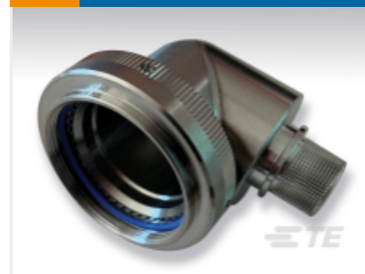
TE 产品编号 EN3660-062W17C EN3660-062W17C