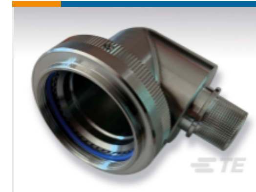
TE 产品编号 EN3660-062F11A EN3660-062F11A