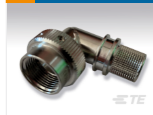
TE 产品编号 EK2581-000 EN3660-065W24H