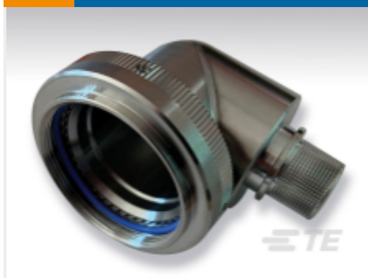
TE 产品编号 EN3660-062W09B EN3660-062W09B