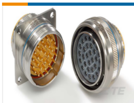
TE 产品编号ZPF000000000039682 983-7SE 20-25 PN