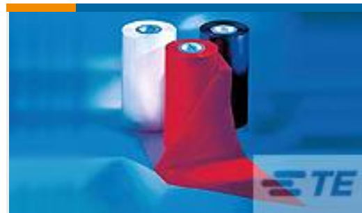
TE 产品编号557721-000 TMS-RJS-RIBBON-4RPSCE