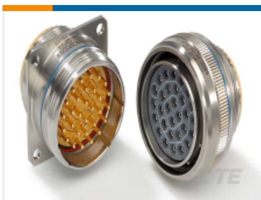
TE 产品编号ZPF000000000038461 983-7RS 14-07 SN