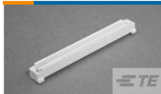
TE 产品编号5177984-2 0.8FH,P05H.5,060,08/Sn,TU