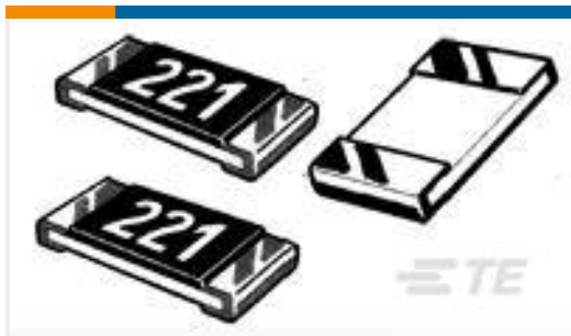
TE 产品编号6-2176070-7 3521 5K6 1% 2W