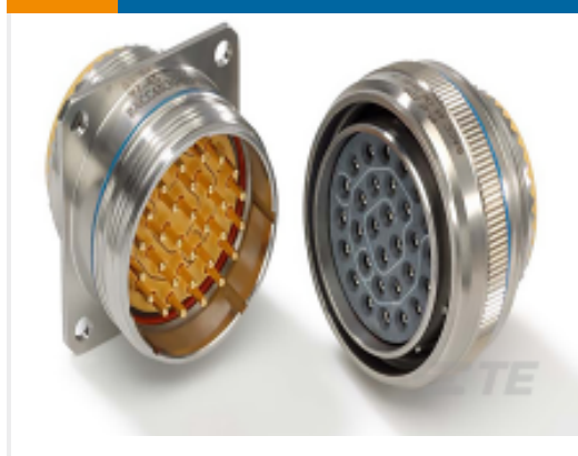
TE 产品编号ZPF00000000009047 983-6SE 28-42 P6 L