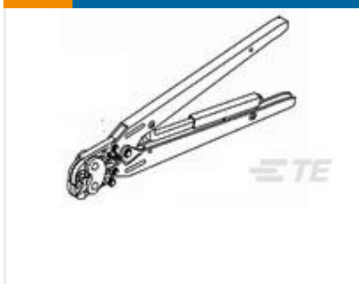
TE 产品编号47386 DAHT PG PIDG 26-16 ASSY