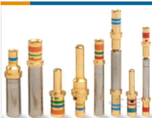
TE 产品编号ZPF000000000000079 004-0160-16 A