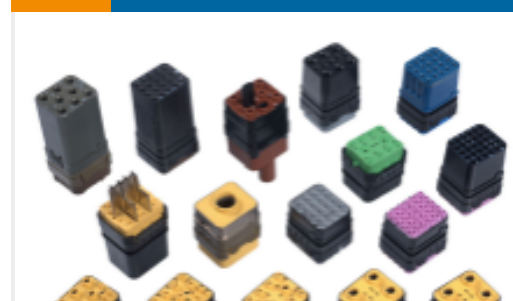
TE 产品编号ZPF000000000015224 DMC-M 08-16 BC