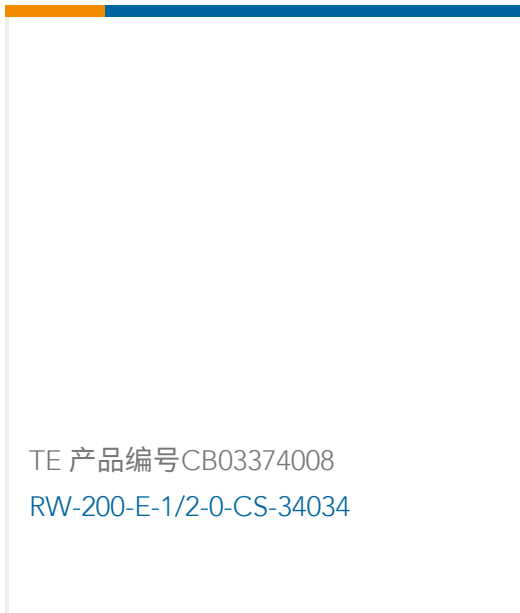
TE 产品编号CB03374008 RW-200-E-1/2-0-CS-34034