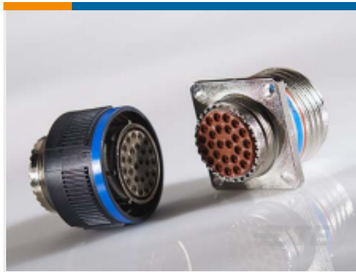
TE 产品编号ZPF000000000017191 DTS 26 S 17-08 SA