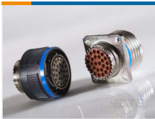
TE 产品编号ZPF000000000017205 DTS 26 S 23-53 SB