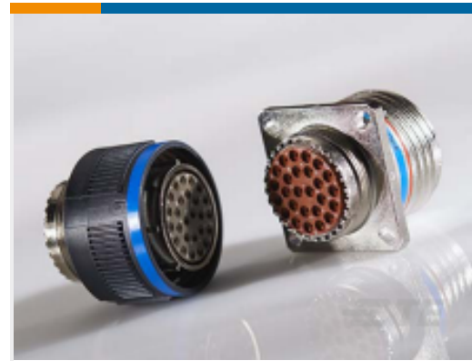
TE 产品编号ZPF000000000017203 DTS 26 S 21-41 SN