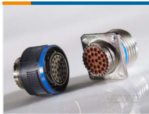
TE 产品编号ZPF000000000095119 DTS 26 S 23-53 SD