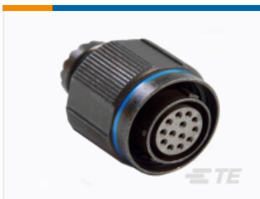
TE 产品编号ZPF0000000000204584 DTS 26 S 21-35 SB