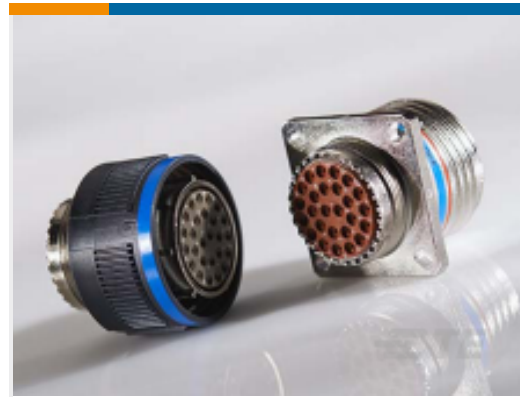
TE 产品编号ZPF000000000017199 DTS 26 S 19-32 SB