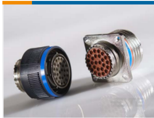
TE 产品编号ZPF000000000017192 DTS 26 S 17-08 SN